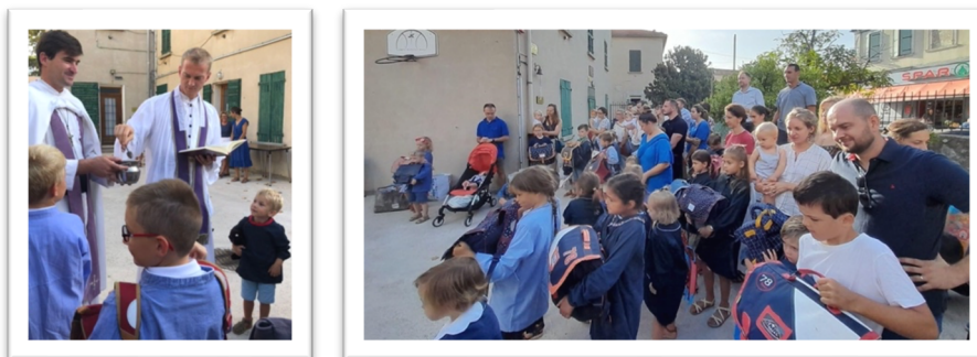
Bénédictio des cartables le jour de la rentrée