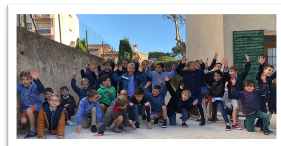
Des élèves heureux en classe comme en récréation